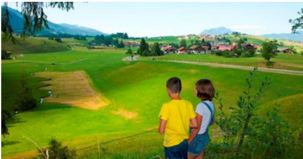
Panoramablick auf Obermaiselstein vom Hirschsprung aus

Obermaiselstein ist ein Dorf der Sagen und Mythen. Die Gemeinde hat dazu im Jahr 2005 den Sagenweg angelegt, auf dem fünf Sagen auch durch Metall-Kunstwerke der Künstlerin Hildegard Simon aus Hindelang in Szene gesetzt werden. Auf Informationstafeln werden die Sagen und ihre Hintergründe wiedergegeben sowie geologische Details und Traditionen erläutert. Auch finden sich Hinweise zu den einzelnen Sagen entlang des Sagenweges mitten im Wald oder im Bach; der Weg ist bewusst als Entdecker-Wanderung angelegt worden.