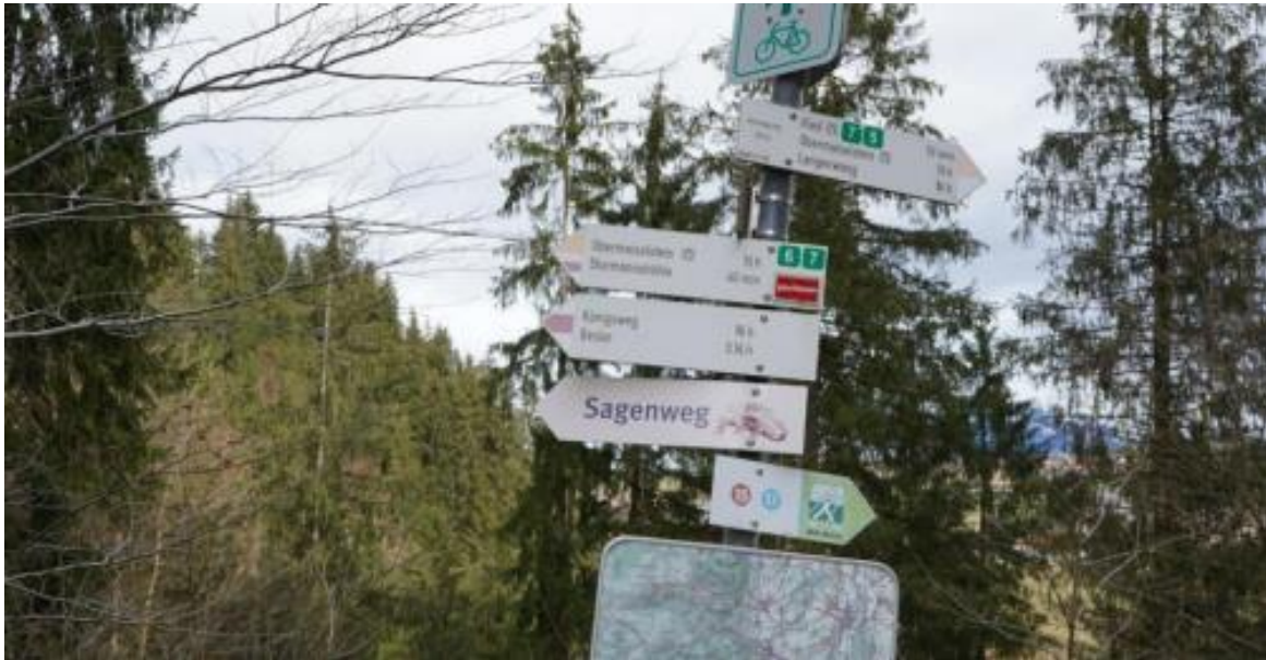
Eingang Sagenweg © Tourismus Hörnerdörfer, Strobel A (14)