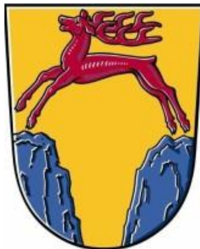
Wappen der Gemeinde Obermaiselstein

Zusätzlich hat die Gemeinde Obermaiselstein 2005 das Obermaiselsteiner Sagenbüchlein herausgegeben. Die Sagentexte „Wilde Fräulein in der Sturmannshöhle“, „Der Geißfüßler auf der Alpe“, „Das Wunderknäble“, „Zigeuner am Schwarzenberg“, „Der Schatz im Sturmannsloch“, „Der Schatz auf der Haubenegg“, „Der Königsweg“ und „Der Venedigerspiegel“ basieren auf dem Standardwerk Sagen, Gebräuche und Sprichwörter des Allgäus I von Karl Reiser (Ausg. 1993) und sind für das Büchlein leicht bearbeitet worden.